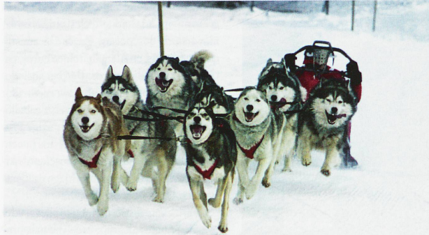
Un tiro de perros en plena acción durante las carreras de trineos tirados por perros en Kandersteg

Escenas como en el Polo Norte, jaurías de perros de trineo que aúllan, barrantando el comienzo inminente de una carrera. Y si bien Norteamérica y Escandinavia son los campeones de esta disciplina, Suiza cuenta con más de 200 «mushers» (conductores de trineo con perros) y unos 3000 perros nórdicos de pura raza. Y donde hay pasión, las carreras proliferan en pleno invierno. Además de la competición y la cría, la estación fría absorbe a toda una industria de turismo de excursiones en trineo con perros, cuya demanda supera ampliamente la oferta. Meterse en la marmita de las grandes epopeyas de Alaska se está convirtiendo claramente en un modo de vida. Los «mushers» suizos más avezados incluso participan en las carreras de larga distancia que han llevado a la gloria a este deporte, como es el caso de Pierre-Antoine Héritier, del Valais, que hizo la carrera Yukon Quest (Alaska-Canadá), de 1600 km, en 12 días el año 2010. Y detrás de la valentía se desvela todo un mundo especial. La vida de los apasionados por este deporte y la de los perros nórdicos cuya cría está estrictamente reglamentada en Suiza para preservar la pureza de las razas. Deslicémonos, pues, tras las huellas de los perros nórdicos, de los criadores y los «mushers» de Suiza.