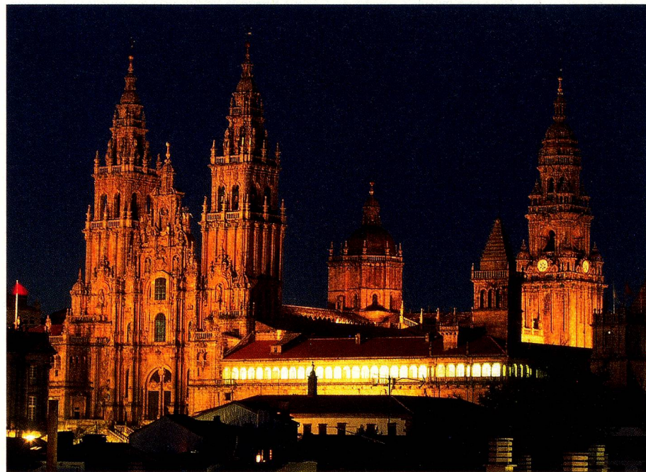
La catedral de Santiago de Compostela

ruta cada año. Después se calmaron la cosas durante algunos siglos. El impulso para el relanzamiento se debe a Elías Valiña, párroco del pueblecito gallego de O Cebreiro, en 1982, que tras la visita del Papa Juan Pablo II a Santiago de Compostela, en la que recordó a los católicos la ancestral tradición del Camino de Santiago, empezó a marcar con postes amarillos el Camino Francés entre los Pirineos y Santiago de Compostela, y abrió un albergue de peregrinos junto a su iglesia. La publicidad funcionó de maravilla, y parece que era el momento propicio para nuevas avalanchas de peregrinos. Ya en 1993, la UNESCO declaró el Camino Francés Patrimonio Cultural de la Humanidad.