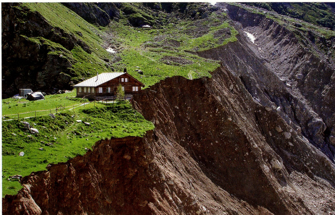
En mayo de 2005, la cabaña de Stieregg se encontró de pronto al borde de un barranco. Una gigantesca morrena se había desprendido por el enorme retroceso del glaciar inferior de Grindelwald. Como consecuencia de este retroceso, se derribó la cabaña de Stieregg

Cuando hace más calor, la vegetación dura más tiempo y la cosecha de algunas tierras es mayor: esta es una frecuente objeción a los angustiados. Pero para el Presidente de la Asociación de Agricultores Suizos y Presidente en funciones del Consejo Nacional, Hansjörg Walter (UDC, TG), este enfoque es de poco alcance. Según Walter, además de la inseguridad del suministro de agua son sobre todo los fenómenos atmosféricos extremos los que repercuten negativamente en la agricultura, principalmente porque aún no hay ningún seguro asequible que cubra los nuevos peligros: «El riesgo para la producción de los agricultores aumenta con el cambio climático». Walter espera también tiempos desapacibles porque el cambio climático agitará en todo el mundo los precios de los productores: «Prevemos mayores fluctuaciones». Walter también vaticina tiempos