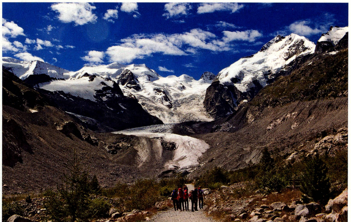
El Glaciar del Morteratsch, en el cantón de Los Grisones, ha retrocedido más de dos kilómetros en los últimos 100 años

Queda claro que la lucha contra el cambio climático es una ardua tarea para Suiza porque cuenta con grandes diferencias topográficas y climáticas en una superficie pequeña. La biodiversidad, por ejemplo, es notable porque nuestra flora y fauna se adaptan a diversas altitudes. El clima cambia, pero no la topografía: los animales y las plantas que se sienten bien a una determinada altitud deben crecer