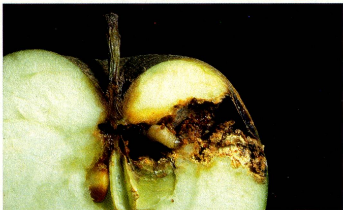
La polilla del manzano: pronto habrá tres generaciones en cada estación del año debido al calor

MARC LETTAU es redactor de «Panorama Suizo»