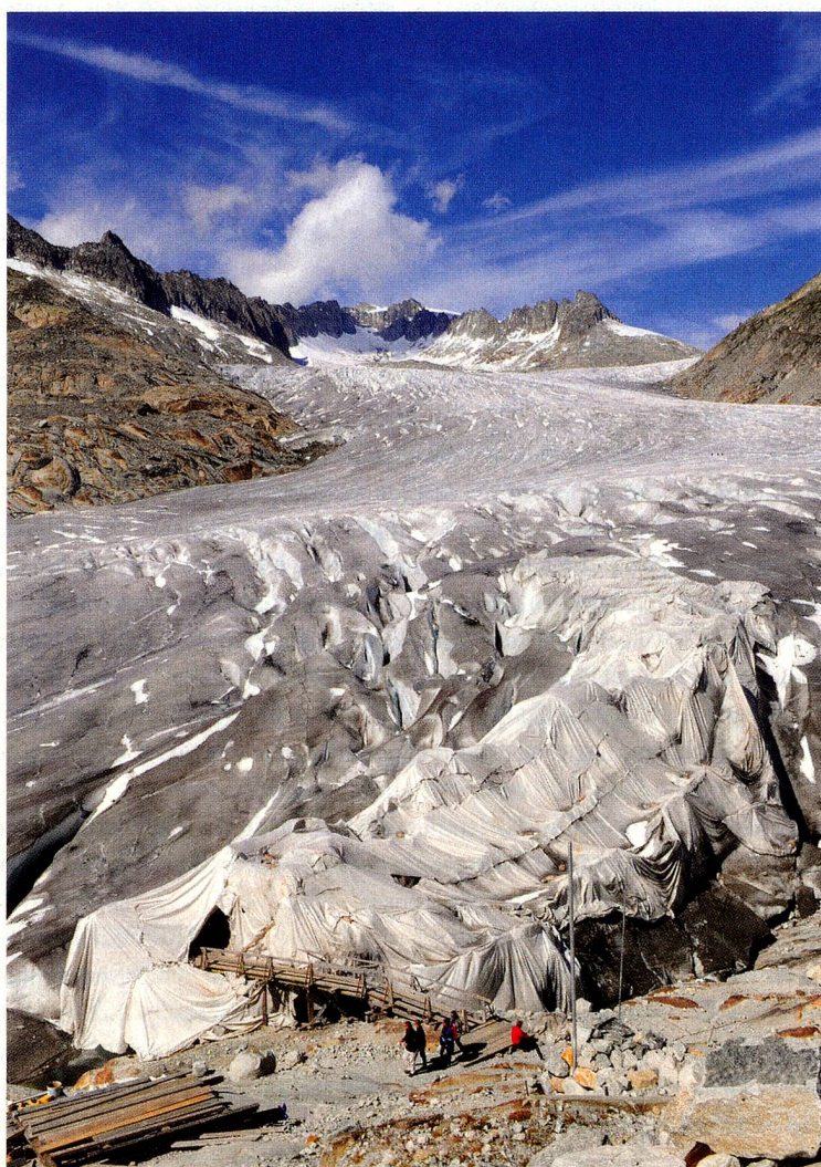
La gruta de hielo del Glaciar del Ródano en el Valais es cubierta con un velo por el fuerte derretimiento de hielo registrado

Pero las montañas siguen siendo muy importantes. Las esperanzas de los especialistas del turismo coinciden con las previsiones de los investigadores: una creciente demanda de vacaciones en las montañas por