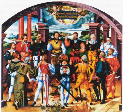
El juramento de confederación con los representantes de 13 cantones, con San Nicolás de Flüe delante, a la izquierda. Este cuadro de Humbert Mareschet, de 1586, puede verse en el Ayuntamiento de Berna