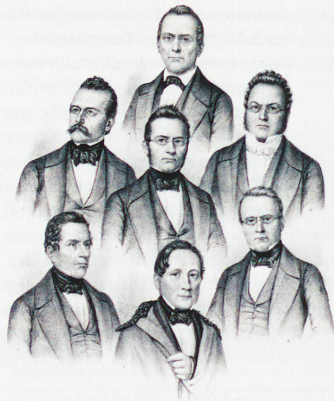
El primer Consejo Federal en 1848. En el centro, el Presidente de la Confederación, Jonas Furrer; Josef Munziger, Henri Druey, Wilhelm Matthias Naeff, Friedrich Frey-Hérosé, Stefano Francini y Ulrich Ochsenbein (en el sentido de las agujas del reloj, desde arriba)