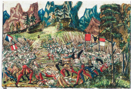
La Batalla de Morgarten (1315) fue la primera batalla de los confederados contra los Habsburgo. Representación extraída de la crónica ilustrada de Christoph Silbereysen de 1576