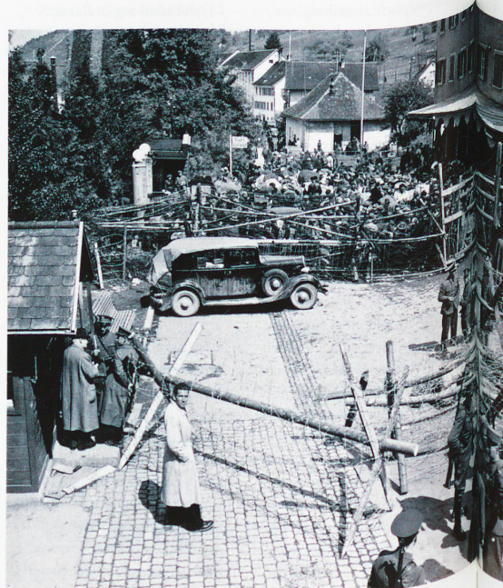
Refugiados tras la verja de la frontera de St. Margrethen, San Gall, mayo de 1945

ilustrado, Maissen lleva a cabo un impresionante bosquejo, sin grandilocuencias, de la trayectoria y el desarrollo del pueblo suizo, insumiso y a menudo litigante dentro de sus propias fronteras, hasta convertirse en una sociedad moderna con un Estado eficiente. Por otra parte, en esta obra se desmitifican fábulas como las del juramento del Rütli, el flechazo a la manzana o la