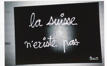
Contribución del artista Ben Vautier a la Exposición Universal de Sevilla en 1992. ¿Se trataba de un reconocimiento de la diversidad de Suiza o un rechazo de la patria? En cualquier caso, despertó una gran indignación