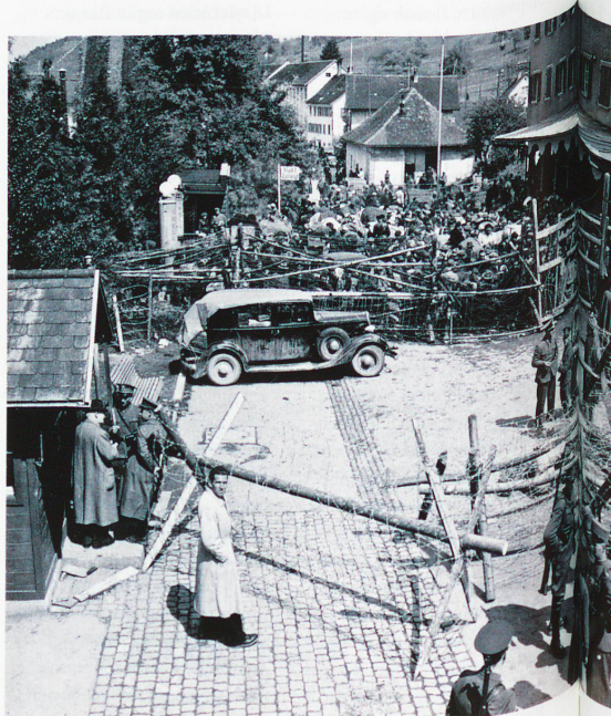
Refugiados tras la verja de la frontera de St. Margrethen, San Gall, mayo de 1945