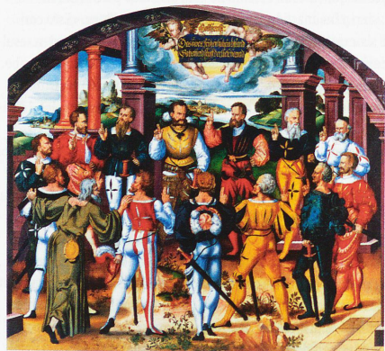
El juramento de confederación con los representantes de 13 cantones, con San Nicolás de Flüe delante, a la izquierda. Este cuadro de Humbert Mareschet, de 1586, puede verse en el Ayuntamiento de Berna