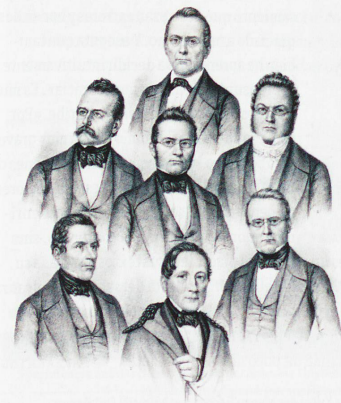
El primer Consejo Federal en 1848. En el centro, el Presidente de la Confederación, Jonas Furrer; Josef Munziger, Henri Druey, Wilhelm Matthias Naeff, Friedrich Frey-Hérosé, Stefano Francini y Ulrich Ochsenbein (en el sentido de las agujas del reloj, desde arriba)