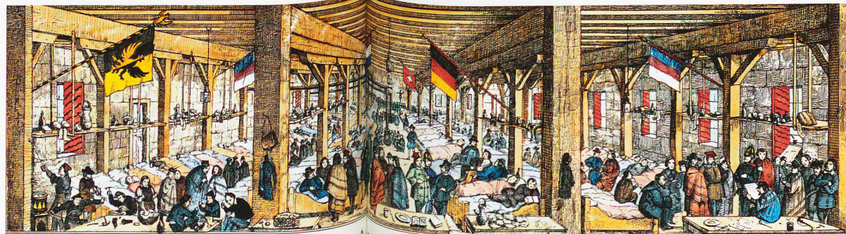
Großer Flüchtlings-Salon im Kornhaus in Bern, Januar 1850. Salon des réfugiés