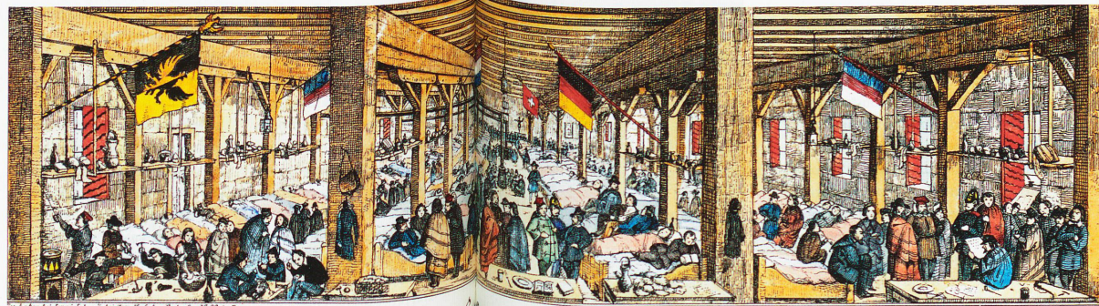
Großer Flüchtlings-Salon im Kornhaus in Bern, Januar 1850. Salon des réfugiés