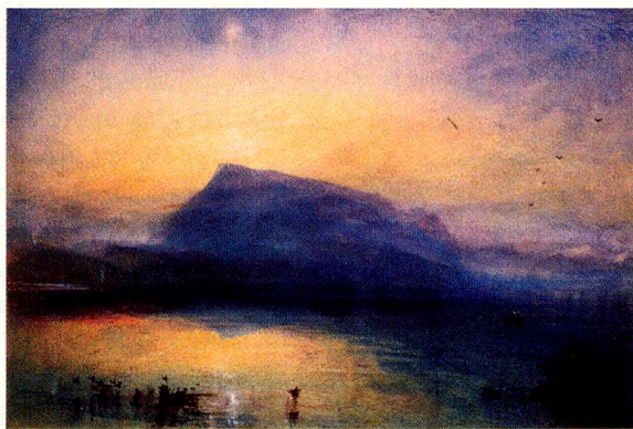
El cuadro mundialmente famoso «The blue Rigi» de William Turner