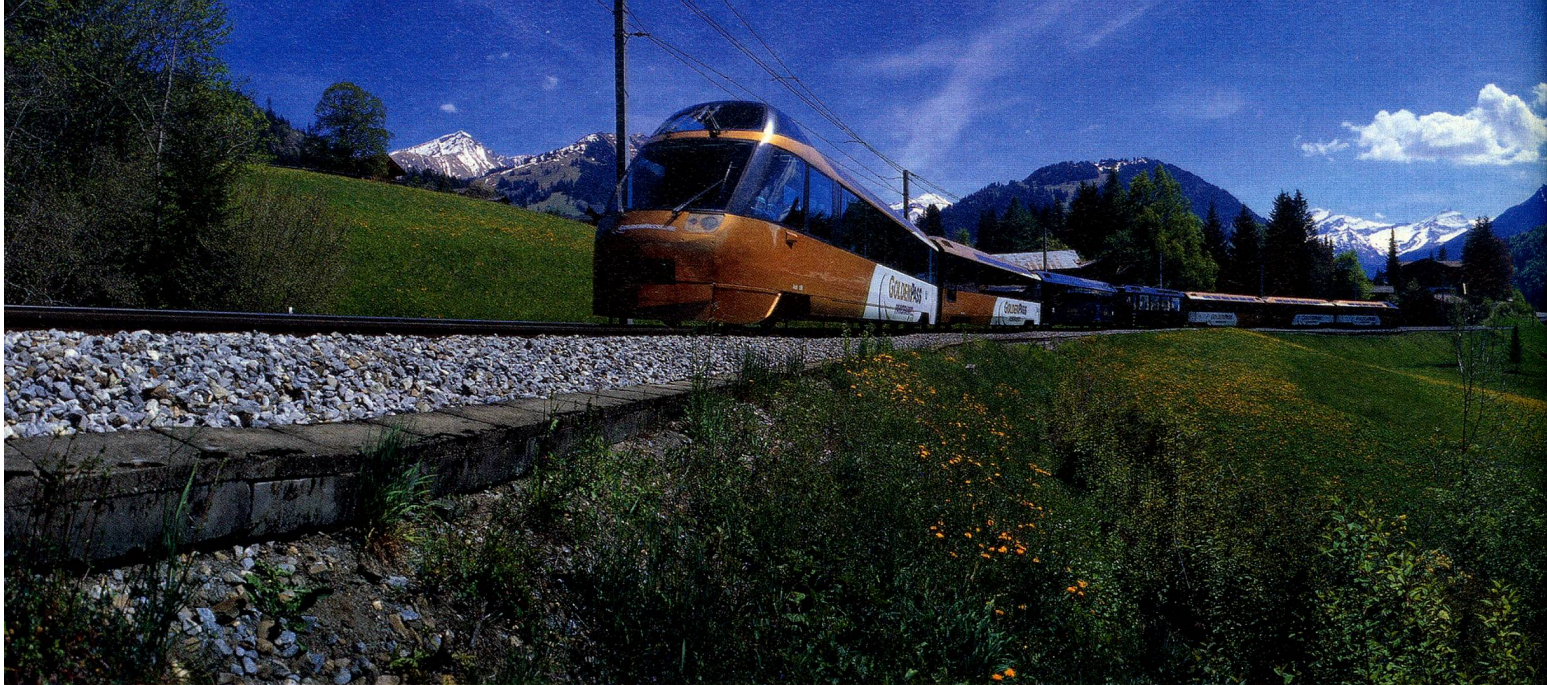
Tren panorámico GoldenPass Line, Oberland Bernés