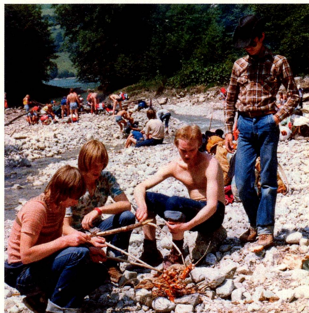
Fotos del campamento de 1978. ¿Se reconoce en alguna de estas fotos? Si es así, ¡póngase en contacto con nosotros! sjas@aso.ch