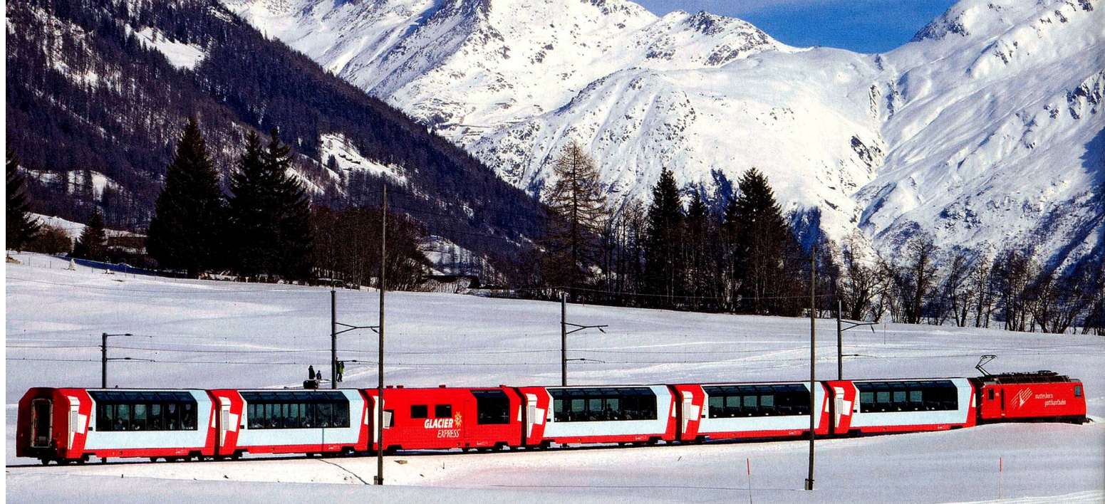
El Glacier Express en el Goms, Valais