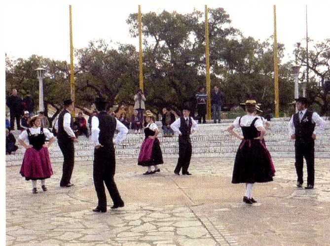
Cuerpo de Baile "Encantos Alpinos"

En su sede de la calle Lavalle 115 en la pintoresca ciudad de