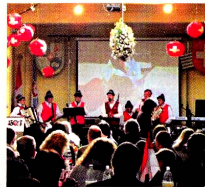
Centro Helvético-5 de agosto

El domingo 5 de agosto, en el marco de los 150 años de la Colonia Suiza y los 721 años de la Confederación Helvética, se realizó el Acto Inauguración de las