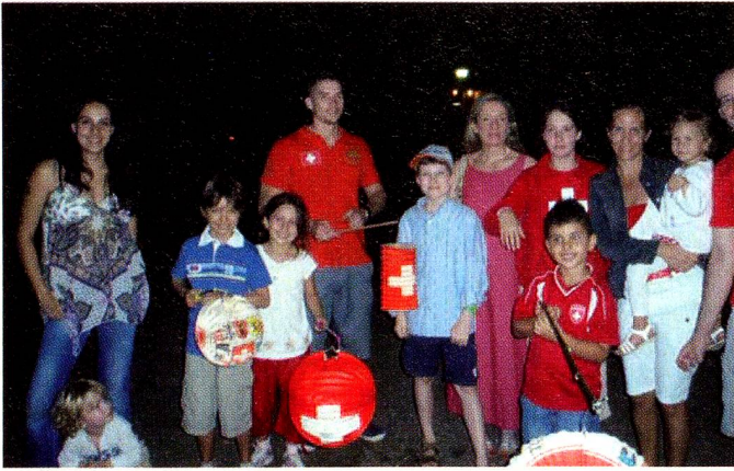
Los niños con sus faroles. En el centro, la Sra. Embajadora

amistades con los diferentes pueblos. Somos representantes en muchas ocasiones y no subestimamos nuestro aporte para un buen entendimiento entre culturas tan diferentes.