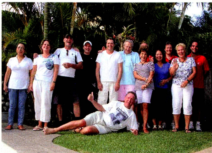
Torneo de tenis (Enero de 2012)

Después de la Asamblea General en octubre del año pasado en el Hotel Palma Real con una excelente atención, se iniciaron las actividades curriculares y extra-curriculares en la Asociación Suiza.