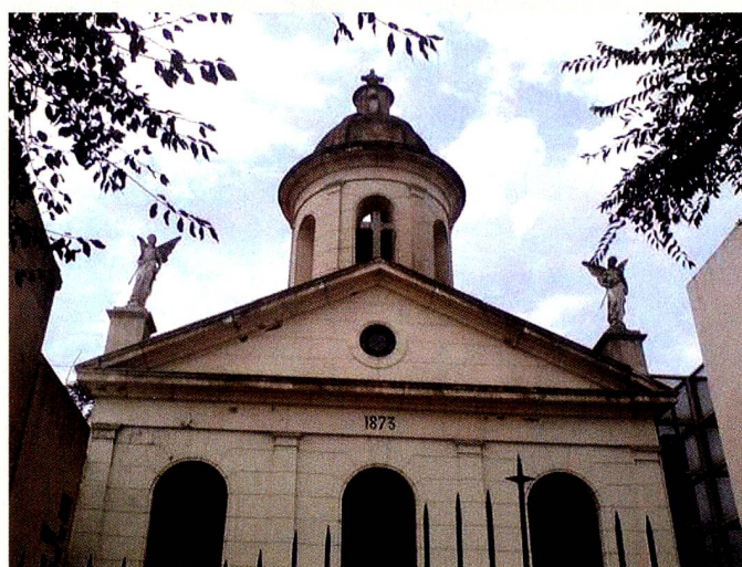
Capilla construida por Francisco Beltrami