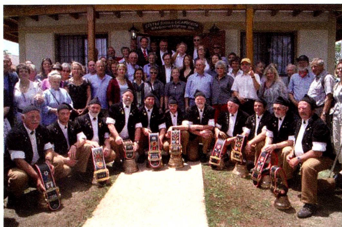
Bergjodler Sigriswil junto a la delegación suiza