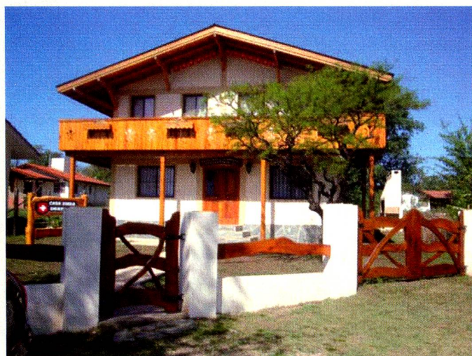
Casa Suiza Sede Sigriswil en Villa General Belgrano

A la tarde hubo paseo en lancha por la zona de islas y riachos hasta llegar al Río Paraná, reco-