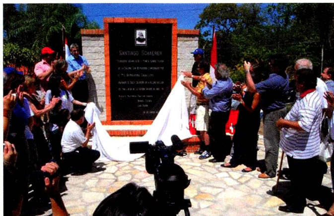
Inauguración del mural "Santiago Schaerer" en la plaza homónima