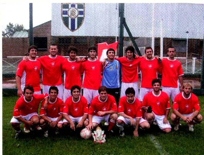
Equipo de fútbol "La Confe"