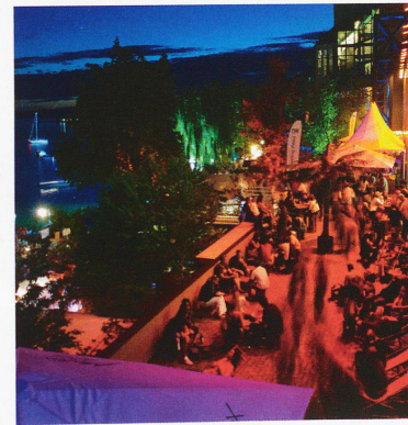
Festival de Jazz, Montreux

Miles Davis como los pianistas Ray Charles y Herbie Hancock o el músico de blues B.B. King, todos actúan numerosas veces en Montreux. Los dos últimos forman, por cierto, cabecera de cartel en la programación de 2011. Hoy en día, el encuentro acoge a casi 230.000 visitantes. El festival se diferencia asimismo de sus homólogos por sus sesiones de «jam» o improvisación de antología, que se inician en plena noche en el Café Jazz de Montreux mucho después del fin de los conciertos oficiales. En 2009, Prince sorprendió a los asistentes al festival tocando en el «antro» de los noctámbulos a las 3 de la mañana. Pero el ambiente distendido del festival no se detiene ahí, las mayores leyendas se alojan a veces directamente en el establecimiento de Claude Nobs, como el músico de jazz y productor Quincy Jones, que viene prácticamente cada verano a Montreux. Por otra parte, no es raro que el patrón del festival venga a hacer una fiesta colosal en el escenario con su armónica. Además, el Festival de Jazz de Montreux po-