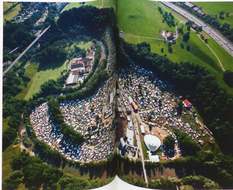
Sittertobel, Openair de Saint-Gall

La receta del éxito de estos eventos culturales reside en el trabajo de los voluntarios. Los festivales pequeños no disponen de personal asalariado y el presupuesto está esencialmente consagrado a pagar a los grupos y costear la infraestructura. Pero cuando su envergadura precisa un grupo de organizadores durante todo el año, se recurre a los profesionales. El festival Paléo tiene, por ejemplo, una plantilla de 55 colaboradores y 4400 voluntarios.