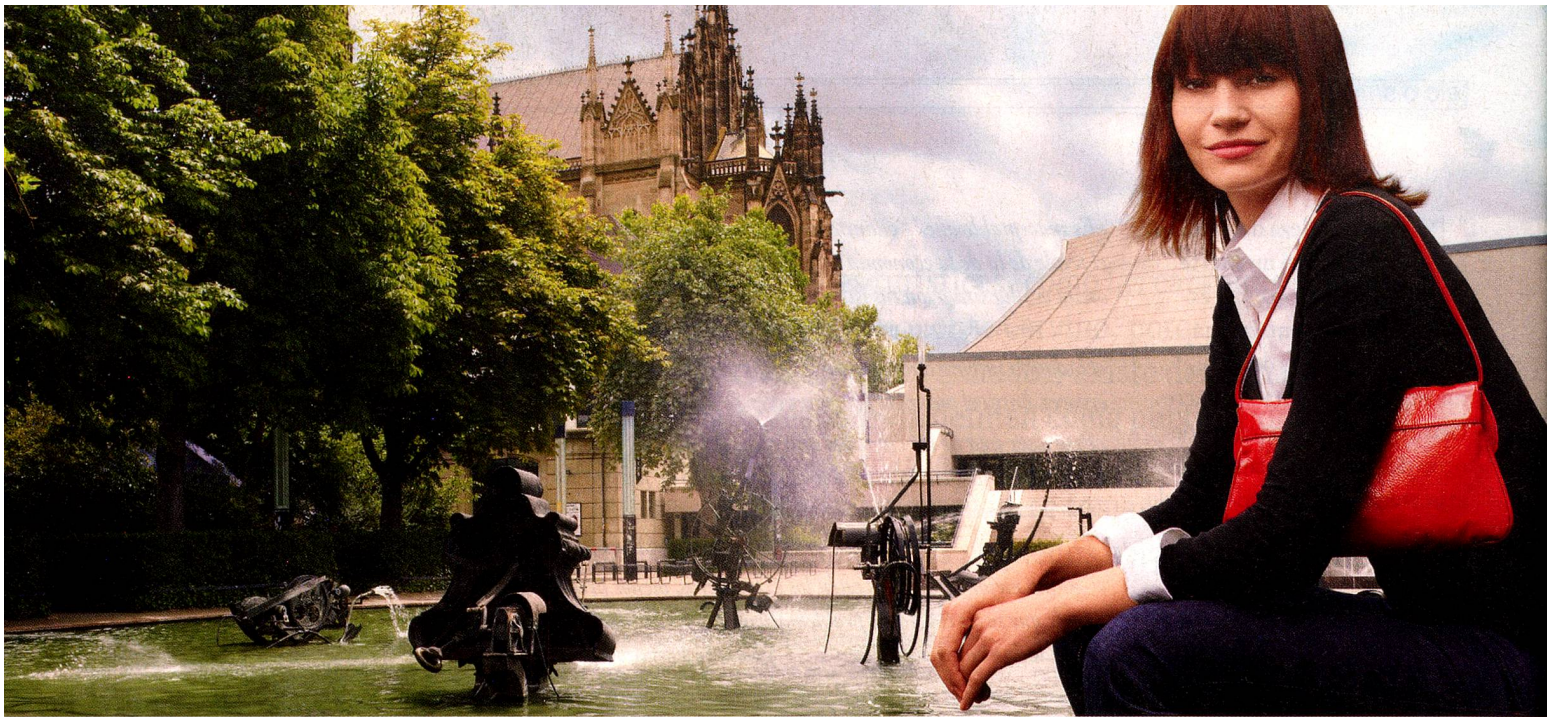
Fuente de Tinguely, Basilea