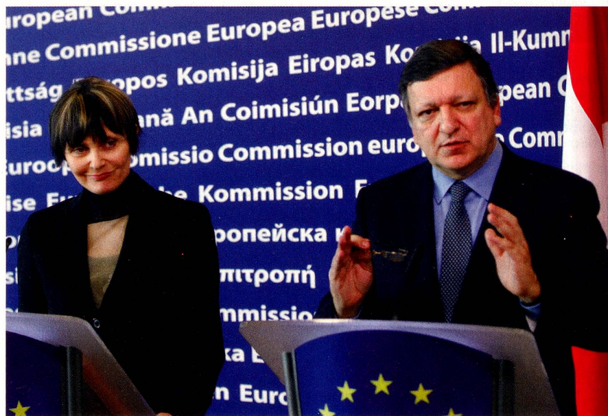
La consejera federal Micheline Calmy-Rey con el Presidente de la Comisión de la UE, José Manuel Barroso, representante de uno de los principales socios de la política exterior

Hay que señalar que, al no ser el inglés una lengua oficial de la Confederación, estas traducciones se facilitan a efectos meramente informativos y carecen de valor jurídico.