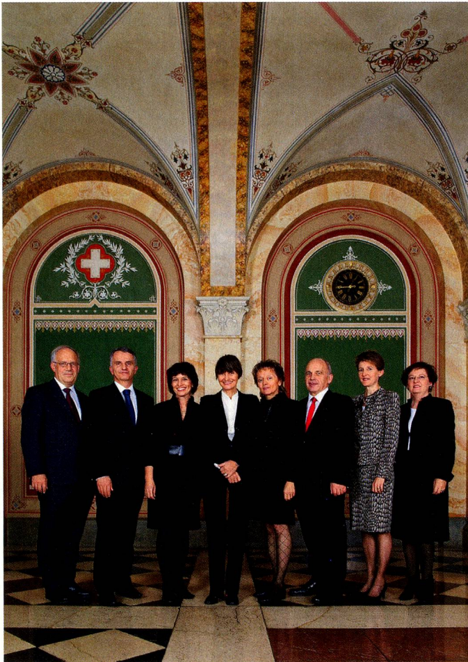
El Consejo Federal al completo (de izquierda a derecha): el consejero federal Johann N. Schneider-Ammann, el consejero federal Didier Burkhalter, la consejera federal Doris Leuthard, la presidenta de la Confederación Micheline Calmy-Rey, la consejera federal Eveline Widmer-Schlumpf (vicepresidenta), el consejero federal Ueli Maurer, la consejera federal Simonetta Sommaruga, la canciller de la Confederación Corina Casanova

Para más información, consulte este enlace: www.admin.ch/br