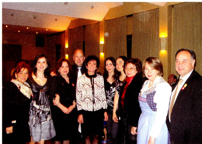
En el centro, la Sra. Embajadora, acompañada por algunos asistentes