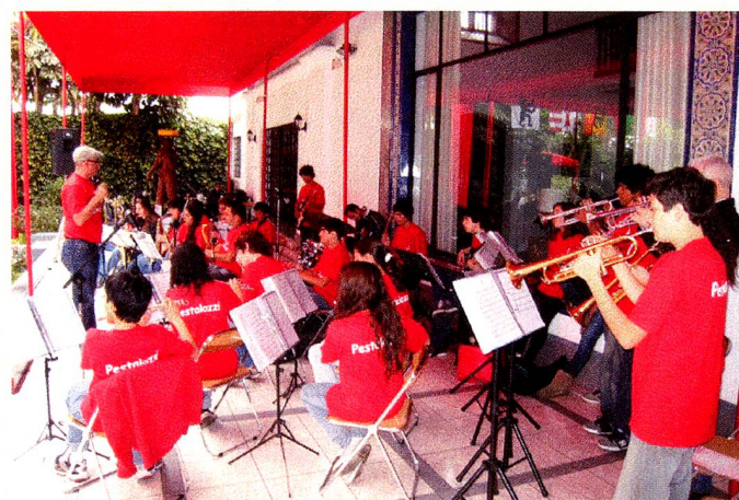
Orquesta del Colegio Pestalozzi