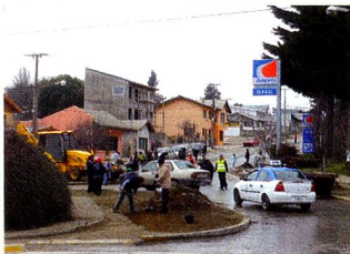
La solidaridad en marcha.

El informe finaliza: "De esta manera sentimos que estamos cumpliendo con lo que nos hemos propuesto y lo seguiremos haciendo con la colaboración de nuestros asociados".