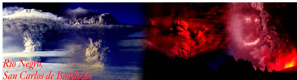
Río Negro, San Carlos de Bariloche