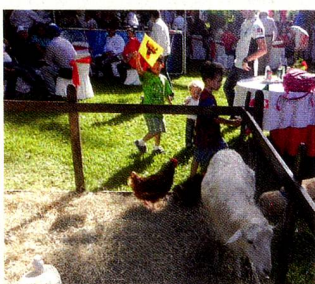
Granja de contacto

El ambiente musical respondió al sonido de los cornos con la cátedra de corno de la Escuela Mozarteum Caracas, recordando