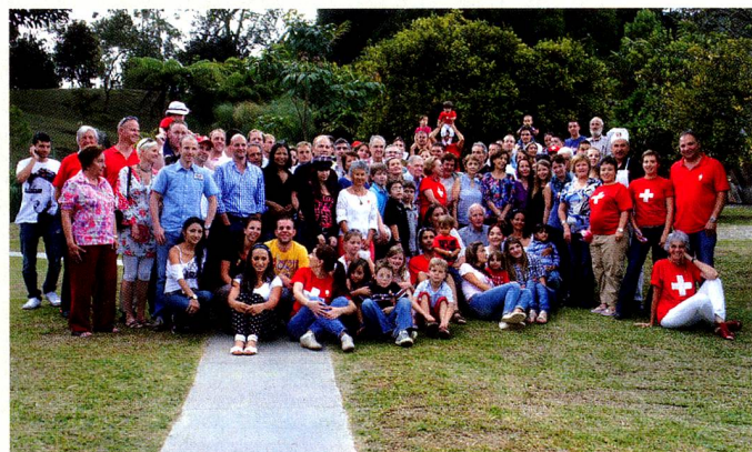
Foto del grupo durante el festejo en Colombia

La fiesta del 1° de agosto se celebró en Medellín con una nutrida asistencia. Más de un centenar de personas pasamos un día campestre y soleado degustando la típica comida suiza: ensalada de papas, ensalada de verduras, salchichas y postre. Varias familias aportaron su esfuerzo para la preparación de la comida y la atención del buffet y las bebidas, para que todo el grupo disfrute de esta ocasión