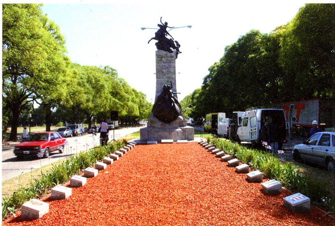
Monumento "Suiza y Argentina unidas sobre el mundo" en el Paseo Suizo.