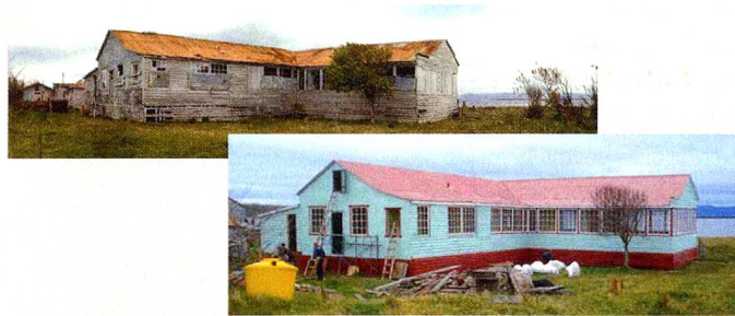
Edificio administrativo antes y después de la restauración