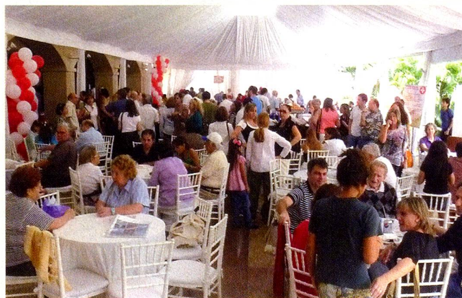
Festival Anual de las Damas Suizas.

En el marco de las actividades de Responsabilidad Social, la FUES organizó una jornada de recolección de juguetes para ser entregados en una merienda, a los niños de uno de los institutos que asiste con distintas actividad y aportes. Los niños Kinder Mis Amiguitos del barrio de Petare de Caracas, recibieron ju-