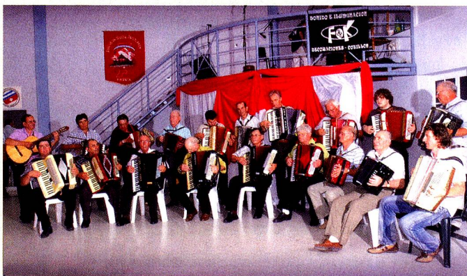
Acordeonistas que participaron