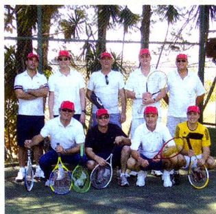
Torneo de tenis 2010

Ultimo Plazo Recepción de Colaboraciones para el N° 3/2011 30 de abril de 2011