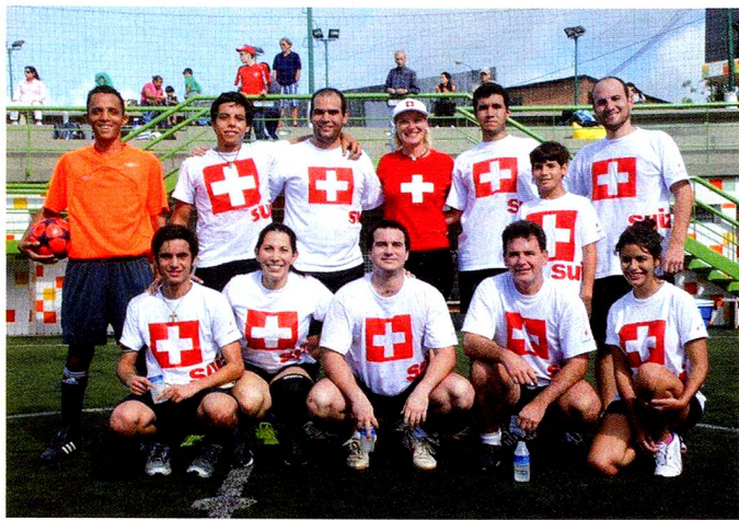
Equipo de fútbol suizo organizado por FUES.

guetes de las manos de San Nicolás en la sede de la Fundación y además, aprendieron a cocinar las típicas galletas navideñas suizas.