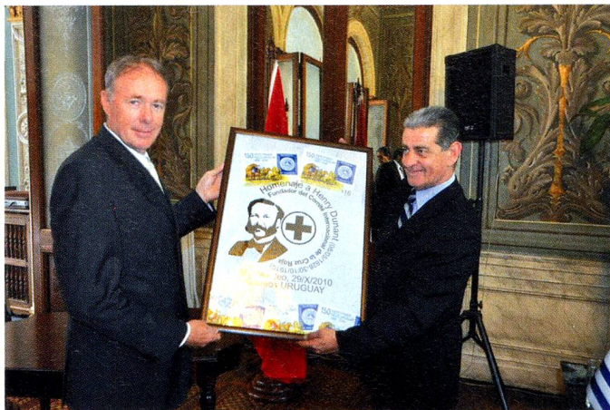
Homenaje a Henry Dunant-Presentación matasello