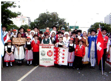
Desfile de la Integración