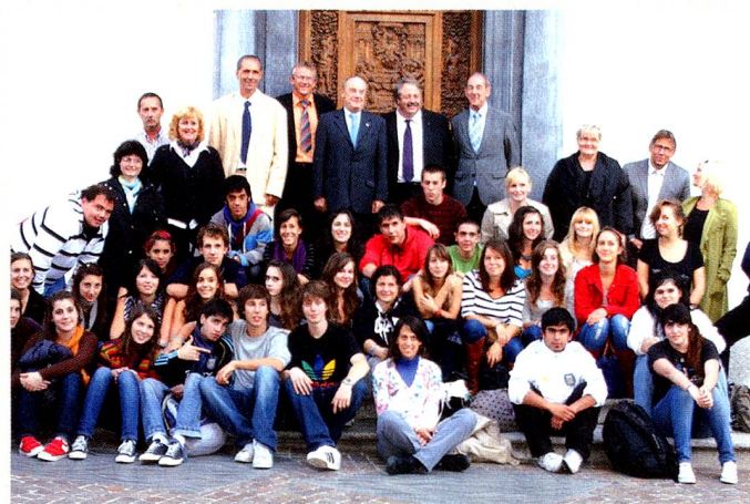
En Suiza, colonenses y valesanos. En el centro, el Embajador de Argentina en Suiza