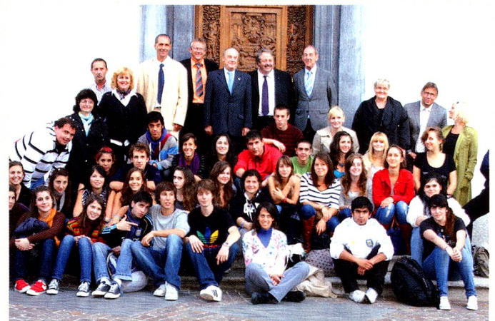
En Suiza, colonenses y valesanos. En el centro, el Embajador de Argentina en Suiza