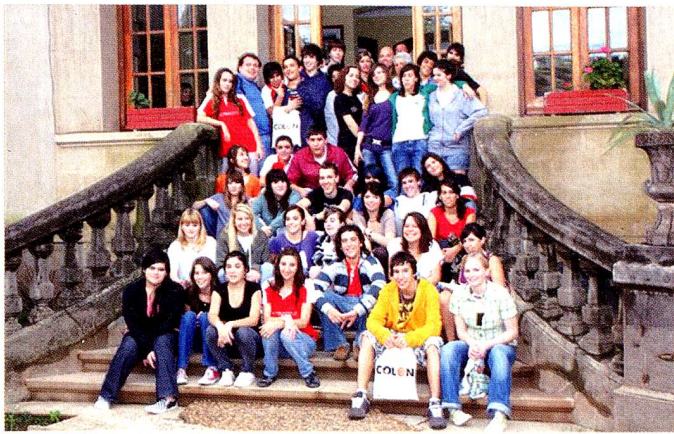
Estudiantes y docentes del intercambio, frente a la Oficina de Turismo en Colón, Entre Ríos-Argentina