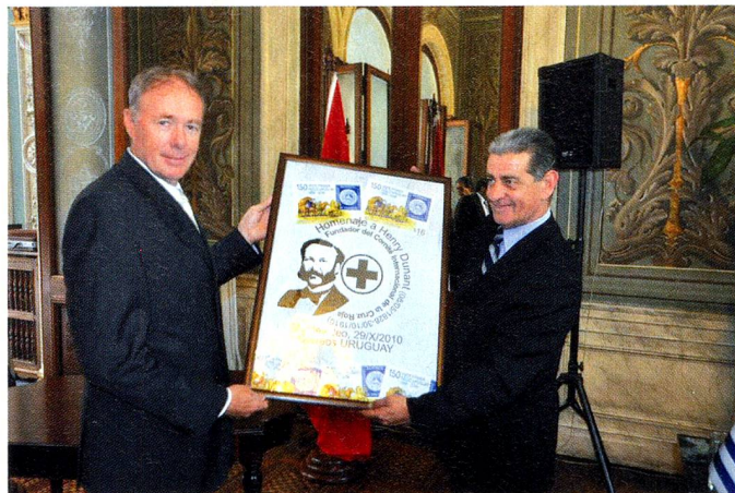
Homenaje a Henry Dunant-Presentación matasello