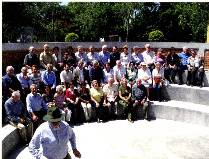
Grupo "60 Plus"

Como siempre fue un agradable paseo en el que volvimos a encontrarnos los integrantes de