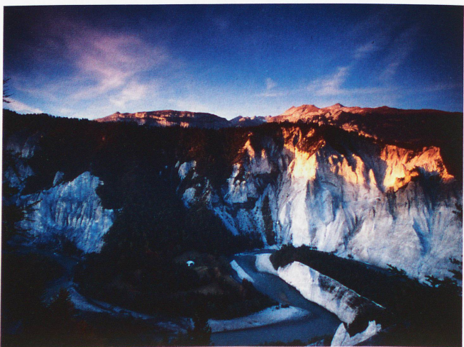
Garganta del Rín