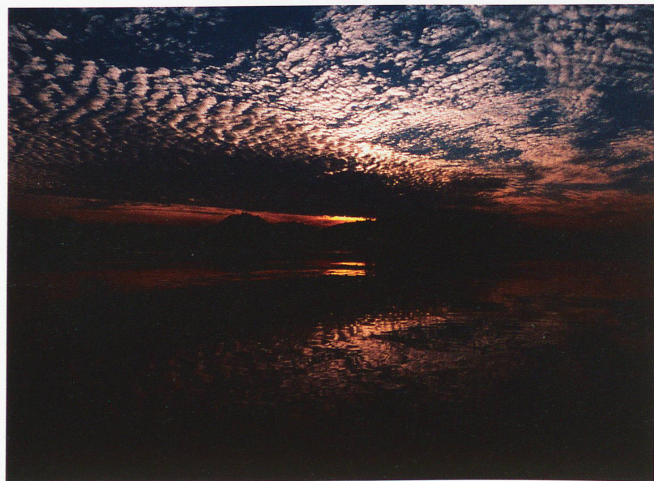
Lago de Zug

cuentra y fotografía es asombroso y muy a menudo totalmente distinto de las impresiones ópticas que tenemos habitualmente de Suiza. Son fotos de Suiza que nos trasladan ópticamente al vasto mundo exterior.