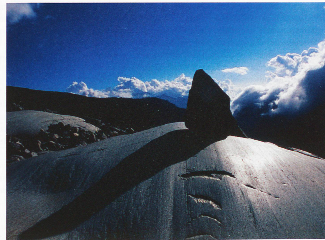
Glaciar del Ródano