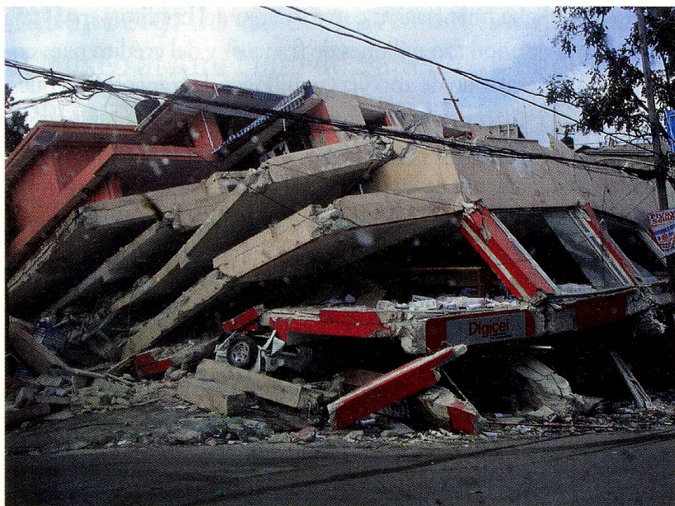
afectados por el terremoto de Haití.

miembros del equipo de intervención (KEP) a Puerto Príncipe y Santo Domingo, y los dos primeros miembros del KEP llegaron pocas horas después del terremoto a la zona de la crisis, de muy difícil acceso. El centro de intervención para crisis instaló inmediatamente en la central un número de línea en directo, donde se atendía 24 horas al día las llamadas de familiares preocupados, se registraban partes de búsqueda o feedback, se comparaban entre sí y se transmitían continuamente a nuestra representación en Puerto Príncipe para ser tramitados.