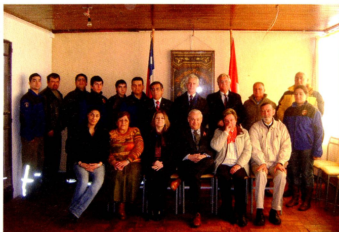
Acto en el Cuartel de Bomberos

El día 1º de agosto a las 12 hs. tuvo lugar la ceremonia de izamiento en el edificio del Cuartel de Bomberos con la presencia de