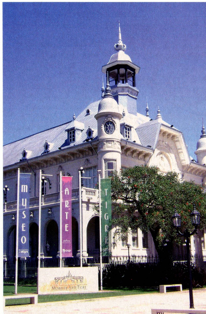
Museo de Arte Tigre

Además, en el Museo de la Reconquista, se expuso "Huellas