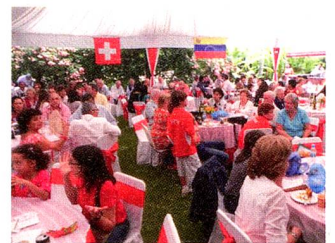
Vista general de la fiesta, con ambas banderas de fondo

La comunidad suiza residente en Venezuela puede a través de la Fundación Espacio Suizo seguir en estrecha relación con las actualidades de los suizos del extranjero a través del portal www.presenciasuiza.org y de las diversas actividades que se desarrollan en la Fundación Espa-