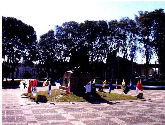
Monumento a los Fundadores