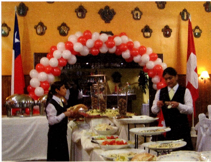
Círculo Suizo de Punta Arenas

bienvenida a los asistentes. A continuación se cantaron los himnos nacionales de Chile y Suiza. El grupo que participa de las clases de francés impartidas por el Círculo Suizo, cantó el Himno Suizo en francés, simpática que creó gran expectación entre los asistentes y fue muy aplaudido.