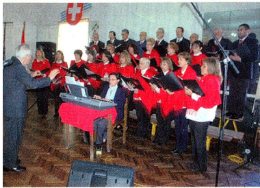
Coro Suizo de Paysandú