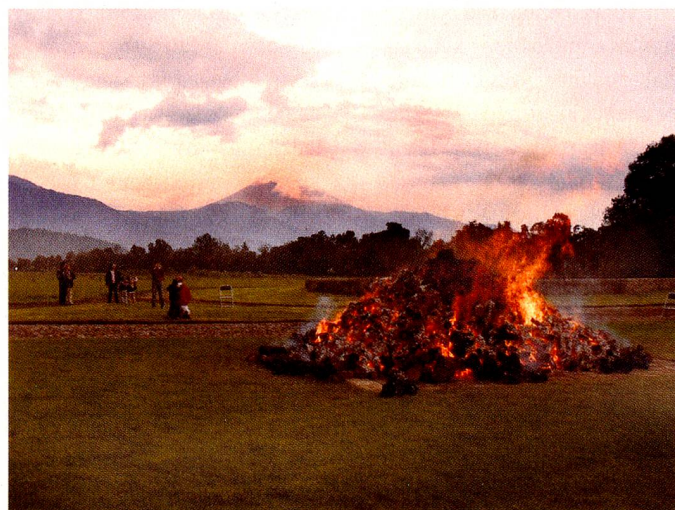
Fogata. Atrás, el volcán Popocatepetl

Como todos los años los suizos en el extranjero sienten nostal-