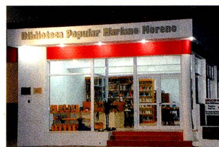
Nuevo edificio Biblioteca Popular "Mariano Moreno"

El día sábado 12 de junio por la tarde, con la presencia de autoridades, representantes de fuerzas vivas y público en general, se inauguró la Biblioteca Popular "Mariano Moreno". El nuevo edificio fue posible gracias al aporte económico del gobierno del Cantón de Valais-Suiza; de VDM -Asociación Valesanos del Mundo- y del periódico "Walliser Bote", instituciones que hicieron el aporte inicial al que se sumó el esfuerzo de la institución. La biblioteca ahora cuenta con un espacio suficiente para el desarrollo de sus actividades y atención de niños y público en general.