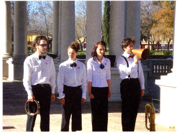
Compañía Teatro Dimitri

de Suiza, representantes de empresas y asociaciones helvéticas, suizos, suizas, descendientes y amigos de la colectividad, integraron el grupo de más de 400 personas que llegaron cerca del mediodía al Museo de Arte y fueron recibidas con un cóctel de bienvenida.