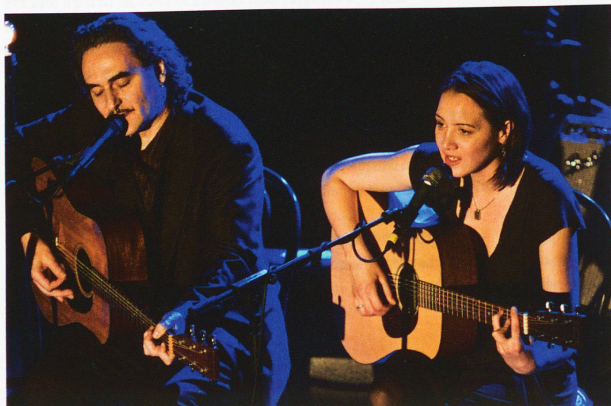
Dan el tono: Stephan Eicher y Sophie Hunger