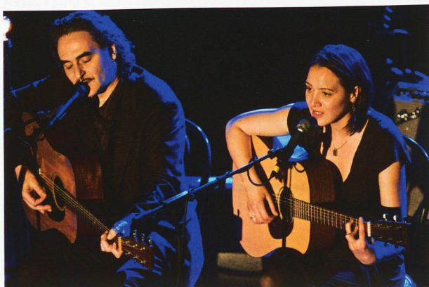
Dan el tono: Stephan Eicher y Sophie Hunger