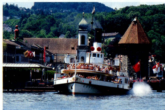
Barco de vapor de la flota del Lago de los Cuatro Cantones, en el embarcadero junto a la estación de Lucerna.

En www.MySwitzerland.com/aso , Suiza Turismo presenta diversas ofertas para estancias cortas y de más larga duración en Suiza. Estas extraordinarias ofertas tienen un descuento de hasta el 35% y están disponibles con regularidad.