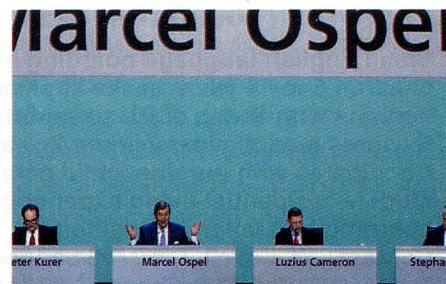
Fotos de prensa del año 2008: La última asamblea general de UBS con Marcel Ospel