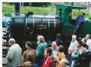
Una meca para los amantes del ferrocarril.