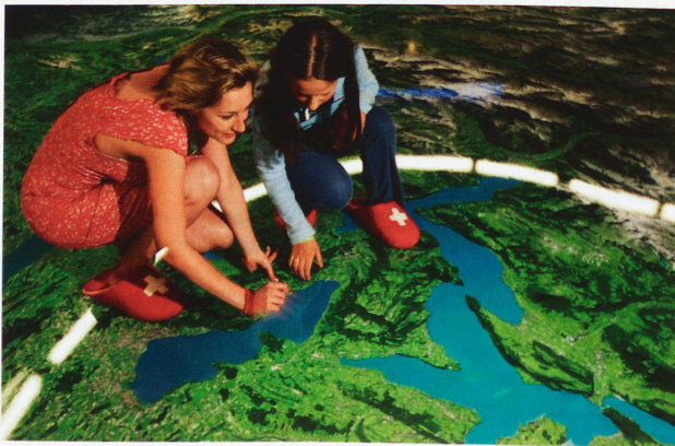
Panorama de Suiza.