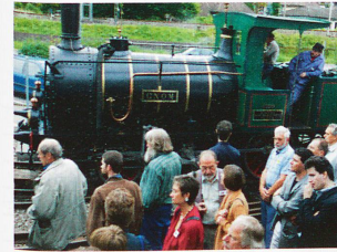
Una meca para los amantes del ferrocarril.