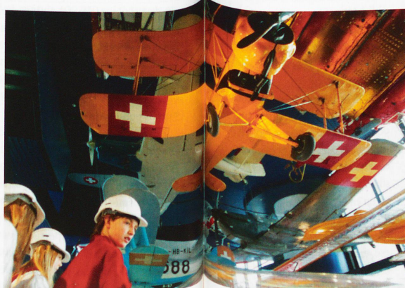
La historia de la aviación.