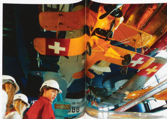
La historia de la aviación.