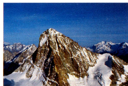
Dent Blanche, cantón del Valais, extracto de «Altitude 4000», véase la página 7.