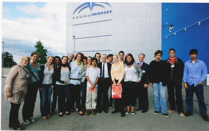
86º Congreso de Suizos Residentes en el Extranjero en Friburgo