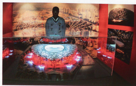
Exposición temporal sobre los Juegos Olímpicos en Pekín. El estadio olímpico, los pictogramas de todos los deportes

Antes de la apertura del Museo Olímpico, el 23 de junio de 1993, las colecciones se expusieron en Lausana, en la Villa Mon-Repos, de 1922 a 1970, y posteriormente en un museo temporal. Por iniciativa del presidente del COI, Juan Antonio Samaranch (de 1980 a 2001), el nuevo museo fue construido por los arquitectos Pedro Ramírez Vázquez, de México, y Jean-Pierre Cahen, de Lausana. El 4º museo de Suiza ya ha recibido más de 2,5 millones de visitantes, de los cuales, el 50% procede del extranjero. Anualmente, recibe unos 200 000 visitantes, de ellos unos 30 000 son escolares. Sus 11 000 m² de terreno están distribuidos en cinco niveles, y su parque tiene unos 22 000 m². El museo posee también un auditorio para 180 personas, cinco salas de reunión, un restaurante, una biblioteca, una videoteca y un servicio educativo para las escuelas. Además, Lausana también es la sede del COI y de la solidaridad olímpica. www.olympic.org