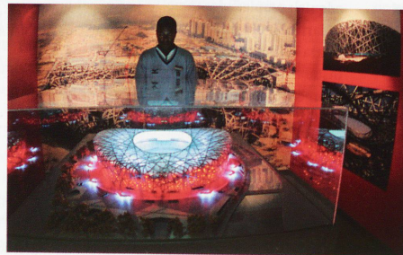
Exposición temporal sobre los Juegos Olímpicos en Pekín. El estadio olímpico, los pictogramas de todos los deportes