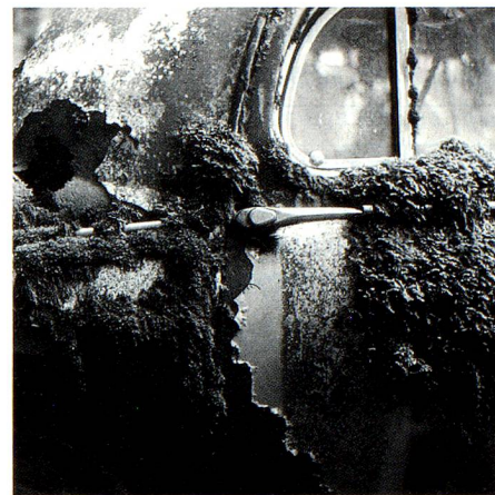
Cementerio de coches de Gürbetal, BE (página 7).