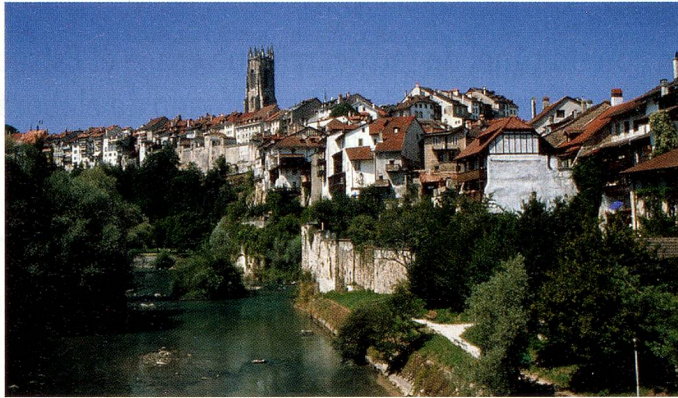
El próximo Congreso de Suizos en el Extranjero se celebrará en la magnífica ciudad de Friburgo.

La adhesión de Suiza al espacio Schengen moviliza a la Quinta Suiza. ¿Qué será de Suiza si desaparecen sus fronteras, o si se suprimen los controles aduaneros de quienes cruzan sus fronteras? ¿Qué pasaría si se aísla de Europa? La introducción definitiva de la libre circulación de personas está sometida a la celebración de un referéndum facultativo. Los cerca de 670 000 suizos residentes en el extranjero siguen con gran interés lo que sucede en su país. Las fronteras, el hecho de ser extranjero, la búsqueda de empleo como extranjero son temas que