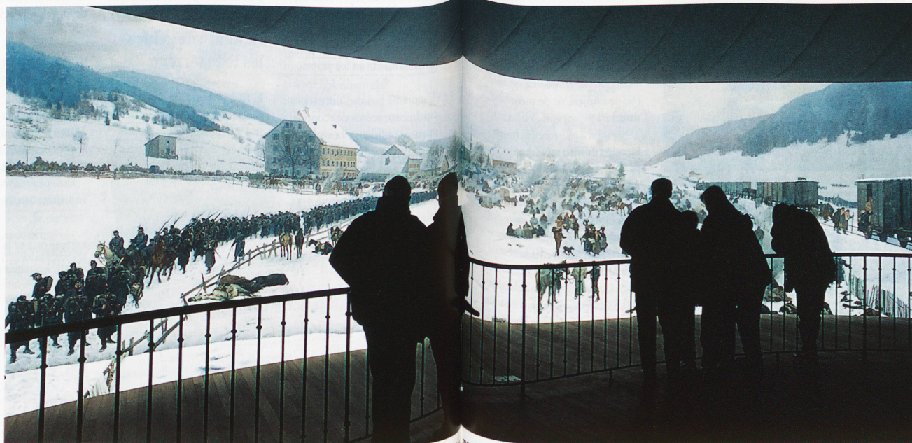
Entrada del derrotado ejército de Bourbaki en Les Verrières: El cuadro de Edouard Castres es un monumento artístico muy importante a nivel nacional e internacional.

El pueblo lucernés aprobó la concesión de un crédito de 14 millones de francos; los 6 millones restantes fueron donados por mecenas. Entre 1996 y 2004, el edificio fue totalmente renovado y el cuadro redondo restaurado. A primeros de marzo de este año también se terminó la explanada, y el nuevo Panorama pudo ser inaugurado.