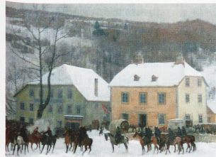
Drama bélico: Detalles del retrato redondo de Bourbaki.