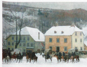
Drama bélico: Detalles del retrato redondo de Bourbaki.