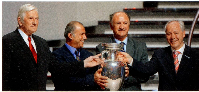
SORTEO PARA LA EUROCOPA DE FÚTBOL 2008: El entrenador de la Selección Nacional Suiza, Jakob «Köbi» Kuhn, el entrenador de Portugal, Felipe Scolari, el de Turquía, Fatih Terim y el de Chequia, Karel Brueckner, de derecha a izquierda, sostienen el trofeo durante el sorteo final para la Euro 2008 en Lucerna, el 2 de diciembre de 2007.

Ha comenzado la cuenta atrás. El equipo suizo conoce a sus