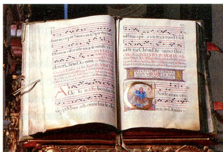
Manuscrito de la biblioteca