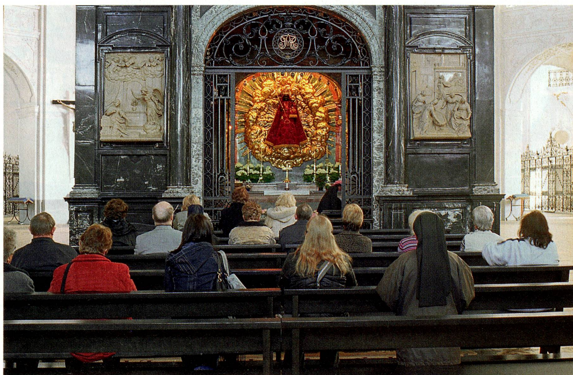
Destino de peregrinos: La virgen negra de la iglesia abacial