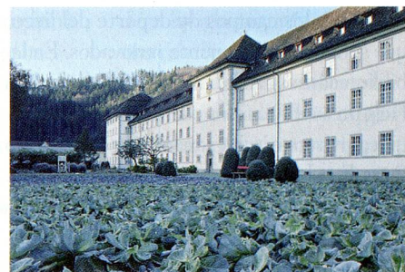
El monasterio se autoabastece