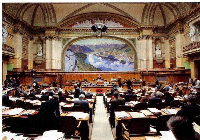
En la sala del Consejo Nacional.

www.parlament.ch/homepage/wahlen-2007.htm www.ch.ch , rúbrica «Behörden» www.bk.admin.ch/aktuell/abstimmung/nrw/index.html?lang=de www.tellvetia.ch