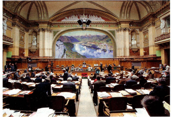
En la sala del Consejo Nacional.