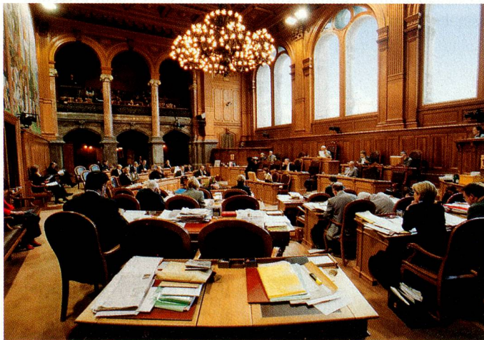
En la sala del Consejo de los Estados.

Las listas sin designación de partido son «listas independientes». Los votos se adjudican a los partidos de los candidatos a los que usted quiera votar y que figuran en la papeleta electoral. Las líneas vacías de esta lista no