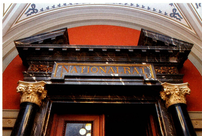
Entrada a la sala del Consejo Nacional.

En las elecciones al Consejo de los Estados rigen las disposiciones cantonales, por eso no se celebran en toda Suiza el mismo fin de semana que las elecciones al Consejo Nacional: En los cantones de Zug, Appenzell Rodas Interiores y en los Grisones, los miembros del Consejo de los Estados son elegidos con anterioridad. En todos los cantones excepto en Jura, los consejeros del Consejo de los Estados son elegidos por mayoría, en la mayor parte de los casos