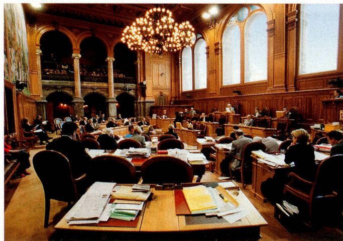
En la sala del Consejo de los Estados.

Las listas sin designación de partido son «listas independientes». Los votos se adjudican a los partidos de los candidatos a los que usted quiera votar y que figuran en la papeleta electoral. Las líneas vacías de esta lista no