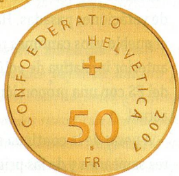
2007: Primer centenario del Banco Nacional Suizo, oro, valor nominal de 50 francos.