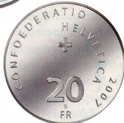
2007: Primer centenario del Banco Nacional Suizo, plata, valor nominal de 20 francos.