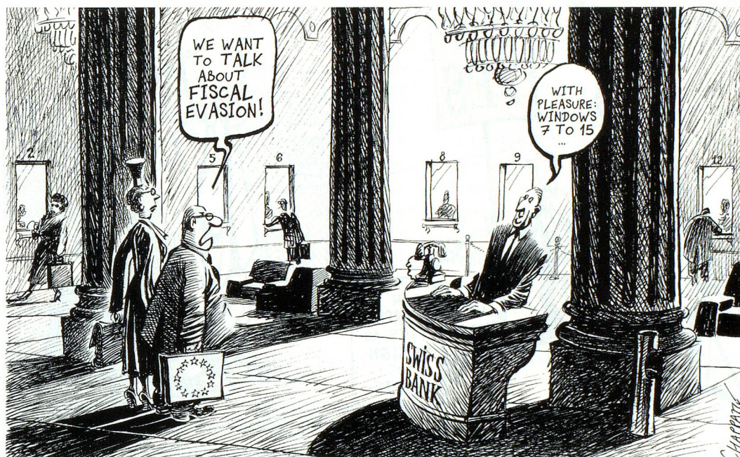
¿Queremos hablar de evasión fiscal! Naturalmente, ventanillas de la 7 a la 15.

También el Gobierno suizo divisa las nubes negras en el horizonte de la vía bilateral. Para la ministra de Asuntos Exteriores, Micheline Calmy-Rey, la estrategia actual es la mejor opción, pero «la bilateralidad no es una