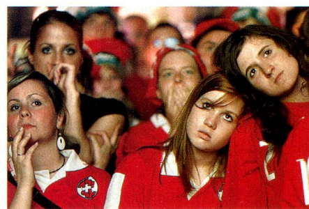
Sufriendo con los futbolistas suizos.