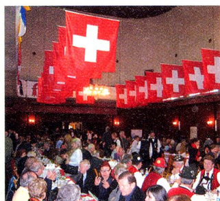
Almuerzo en el salón de la Casa Suiza