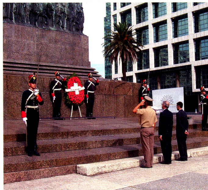
Ofrenda floral del Embajador de Suiza ante el monumento a Artigas

Los importantes visitantes suizos tuvieron oportunidad de conocer a nuestros actuales gobernantes y de observar in situ la situación e incluso en el caso del segundo de los nombrados, visitar Nueva Helvecia, la ciudad donde se concentra el mayor