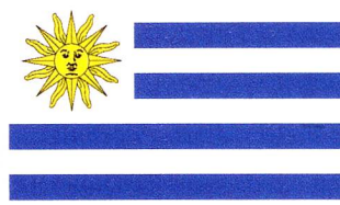
Bandera de Uruguay