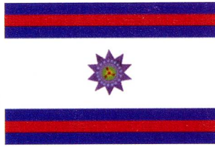
Bandera de Paysandú

En la década del '60 cambió el sistema de asistencia médica con la llegada del régimen mutual. Como la Sociedad no podía funcionar como mutual, descen-