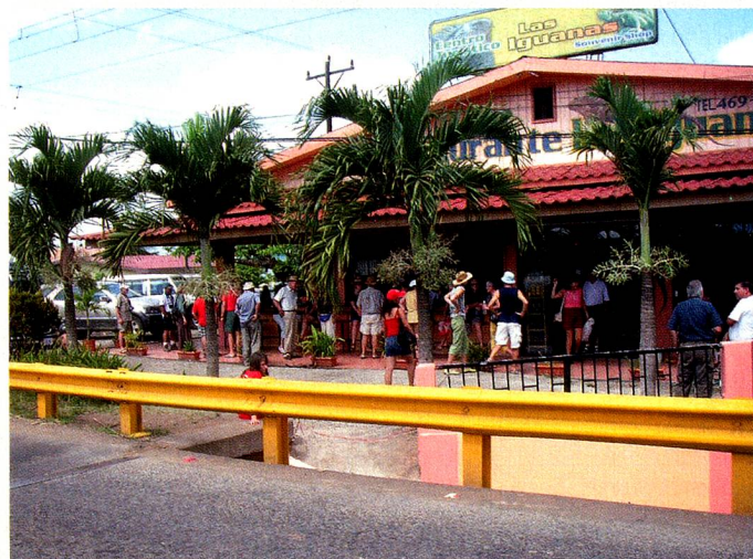
Los viajeros frente al restaurante del centro turístico Las Iguanas

La Fiesta de Pascua se celebró el 15 de abril con un agradable pic nic en el parque Fraijanes en Poás de Alajuela. Cada uno llevó su comida y bebida. El conejo de Pascua ya había escondido en los alrededores, los huevos pintados para los niños y había dejado "Osternestli" -nidos de Pascua- para ellos. La ASOSUIZA ofreció un brindis de Pascua para los adultos, además del tradicional "Eiertütschen"-chocar los huevos-.