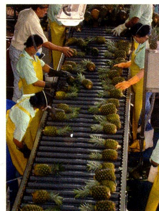
Planta productora y exportadora de piñas frescas

El 30 de marzo un grupo de más de 30 personas se reunieron en el Hotel Tilajari, en Muelle (Arenal) para compartir una cena juntos y luego un juego de naipes. A la mañana siguiente se fue en caravana hasta una plantación de piñas. La visita duró tres horas y fue muy instructiva. Se hizo una parada en el restaurante del centro turístico Las Iguanas, donde había inmensas iguanas, en cantidad. Por la tarde todos tomaron baños de aguas termales en La Fortuna y por la noche, la cena seguida del juego de naipes; al día siguiente cada uno emprendió su regreso a casa, después de haber disfrutado de un fin de semana muy bien organizado y divertido, tanto para los pequeños como para los grandes.