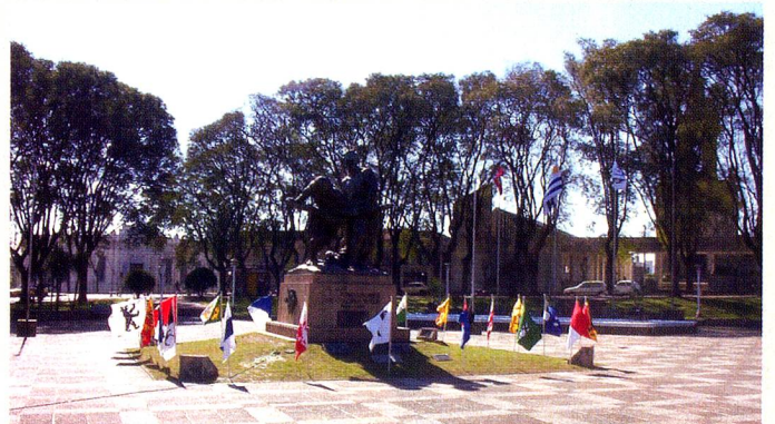
Monumento a los Fundadores de Colonia Suiza