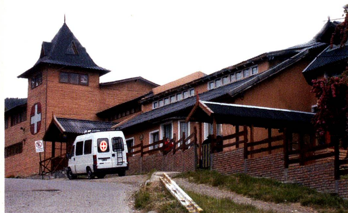
Vista de la entrada del Nuevo Colegio Suizo.