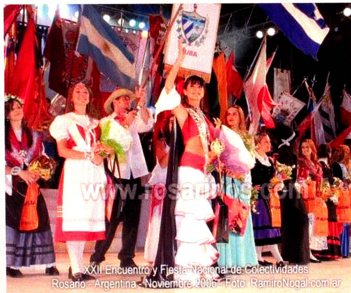
XXII Encuentro y Fiesta Nacional de Colectividades Rosario - Argentina - Noviembre 2006 - Foto: RamiroNogal.com.ar