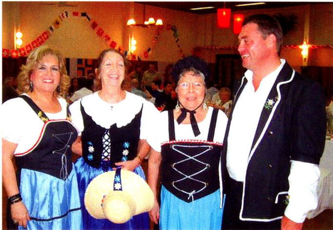
Participantes de la fiesta vistiendo trajes típicos

Como culminación de las actividades del año 2006, la Sociedad Suiza de Beneficencia ha realizado un encuentro ya tradicional: la Fiesta de los Trajes Típicos Suizos, convocando a más de 200 personas entre jóvenes y personas mayores. Se realizó el 25 de noviembre en las instalaciones del Club Alemán. La animación estuvo a cargo de un grupo musical a cuyo ritmo los presentes bailaron con entusiasmo. Fueron premiados los mejores trajes que dieron el colorido a la fiesta. La espectacular decoración del evento que sorprendió a los asistentes, estuvo a cargo de las Damas Suizas. Todos los premios entregados fueron aportados por empresas suizas que tienen su representación en el Paraguay a quienes la SSB les expresa su agradecimiento.