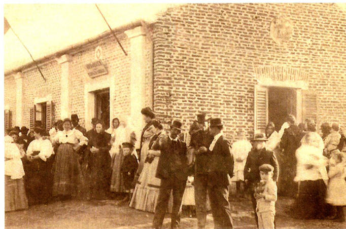
Fiesta Suiza del 1º de agosto. Atrás, el antiguo galpón de la Sociedad Suiza (1906)