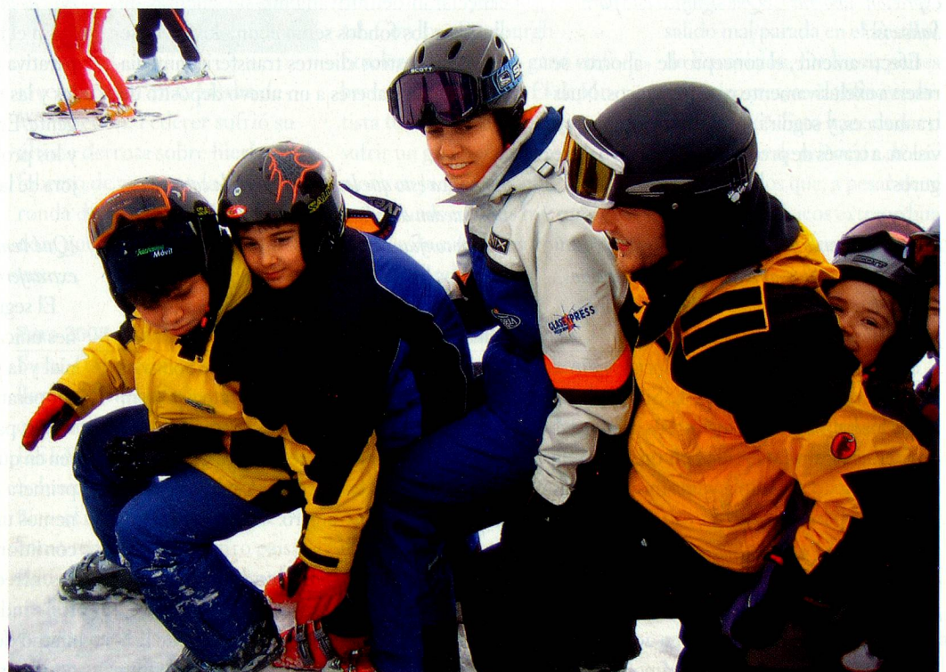
Campamento de invierno de SJAS en febrero de 2006.

Fundación para Jóvenes Suizos Residentes en el Extranjero Alpenstrasse 26 CH-3006 Berna Tel.: +41 31 356 61 16 Fax: +41 31 356 61 01 E-mail: sjas@aso.ch www.aso.ch (rúbrica jóvenes / colonias de vacaciones de 8 a 14 años / campamentos de invierno)