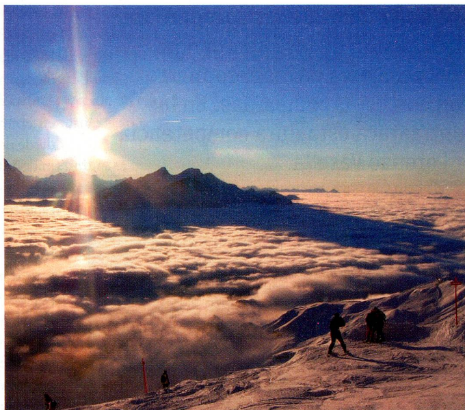
Un clima de ensueño en el campamento de Año Nuevo en Hasliberg

En los cursos de idiomas de dos semanas, los suizos residentes en el extranjero pueden aprender alemán o francés. En nuestro taller tratamos la relación entre economía y cultura, tomando como ejemplo Basilea. Participando en la sesión federal juvenil