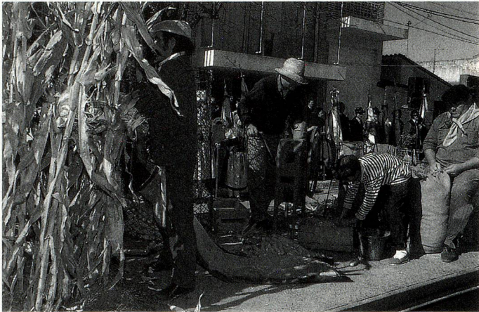
"Cosechando maíz", una de las carrozas evocativas

Desde hace mucho tiempo, el segundo domingo de junio de cada año congrega en la localidad a instituciones suizas de todo el país y de países vecinos, que llegan a ella con el fin de unirse a los festejos conmemorativos que tienen como objetivo "mantener y fortalecer la cultura suiza". El domingo por la mañana, se realiza un importante desfile evocativo del que participan también las delegaciones de instituciones suizas que se hacen presentes con sus coloridos trajes típicos, su alegre música y cuerpos de baile de niños y adultos. Después del almuerzo, los grupos de bailes y las orquestas típicas suizas alegran la tarde en la que todos los asistentes bailan hasta la noche.