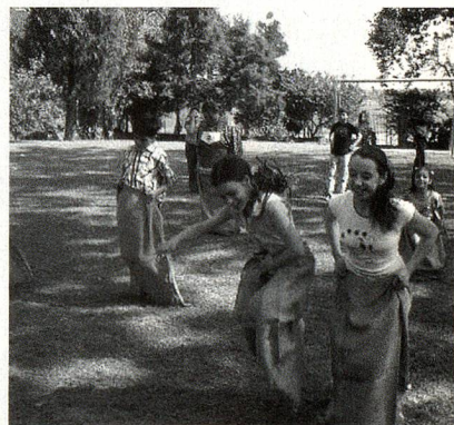
Los niños durante la carrera en bolsas