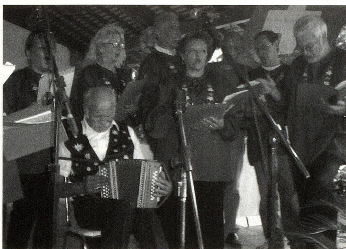
Actuación del Coro