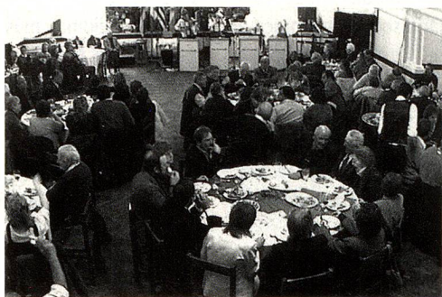
Almuerzo de Confraternidad-Club Artesano

Los festejos de los 715 años de la Fundación de la Confederación Helvética se iniciaron el martes 1º de agosto con el embanderamiento de la Plaza de los Fundadores y de la ciudad con los pabellones de Uruguay y Suiza. A las 7.30 horas se escuchó el tañido de las campanas de los Templos Católico y Evangélico. Se depositaron ofrendas florales al pie del monumento al Gral. José G. Artigas y en la Plaza de los Fundadores. Participaron las Escuelas N° 19 de Soler y N° 126 "Guillermo Tell" de Nueva Helvecia.