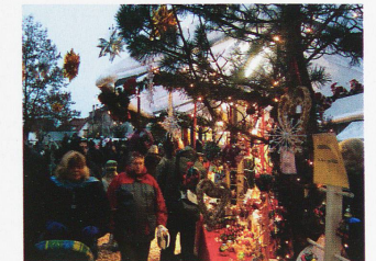
Stans, centro del pueblo

La ciudad histórica de Willisau (cantón de Lucerna) celebra su noveno mercadillo navideño con unos 100 expositores, del 1 al 4 de diciembre, en el centro de la ciudad, donde desde la Edad Media hay un mercado semanal. Muy especial es el mercadillo navideño de Brunnen, en el cantón de Schwyz, donde está la cueva ta-