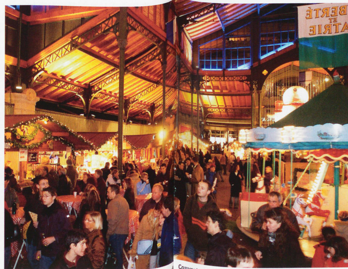
En el mercadillo Couvert, en Montreux