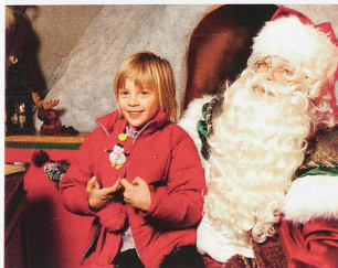
Embrujo navideño para grandes y pequeños

placeres terrenales. Acá se hacen velas a mano, allá es Papá Noel quien recibe en audiencia. Tratar de hacer un recuento de los mercadillos navideños de Suiza sería una tarea interminable. En la última década, su popularidad ha ido ganando terreno. Tanto si son grandes como pequeños, más o menos auténticos, lo cierto es que han conquistado plenamente el corazón de los suizos. Sus múltiples puestos y casetas de madera animan el invierno, engalanando las callejas. El sueño invernal deja paso a una infatigable actividad. Se compra a discreción, se descubren cosas nuevas, se intercambian impresiones. El tranquilo y contemplativo visitante que se deja envolver por el hechizo de este reino encantado ha relegado al turista apresurado. En buena parte son precisamente estos sencillos puestos de madera