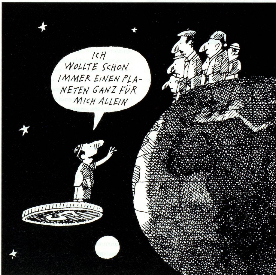
Siempre quisé un planeta para mi sólo.