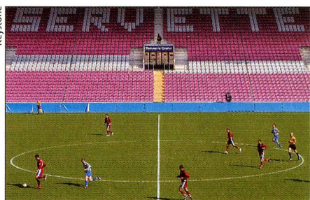
Quiebra del FC Servette de Ginebra.

17 de marzo. El ex-presidente del FC Servette, el francés Marc Roger, está detenido en prisión preventiva. Se le acusa de actuación fraudulenta en relación con la quiebra del club, que entró en vigor el 16 de febrero después de varios meses de proceso de apelación. La próxima temporada el equipo jugará en la 1ª Liga, mientras que la Súper Liga proseguirá con nueve equipos. En sus 115 años de historia este club nunca había ido al descenso. Entre sus palmas hay 17 títulos de campeón y siete victorias en la copa.