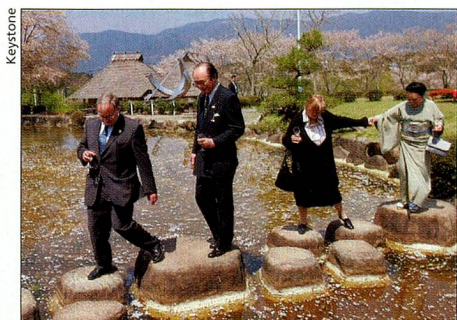
El presidente federal en la Exposición Mundial.

23 de marzo. Inauguración de la Exposición Mundial de Aichi, Japón. La Suiza cultural no se limita en absoluto al pabellón suizo en el «País del Sol Naciente». Pro Helvetia está organizando ya hace dos años un profuso programa en todo el país, destinado a presentar las actividades culturales con-