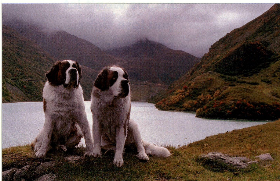
Perros San Bernardo en el paso Gran San Bernardo.