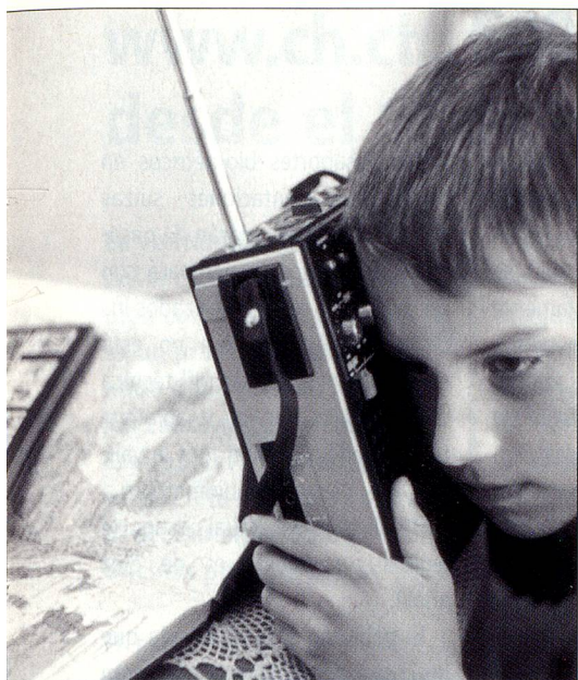
La onda corta deja de servir.

con la patria, antes acentuadamente emocionales, se atenuaron» (según el profesor Walther Hofer).