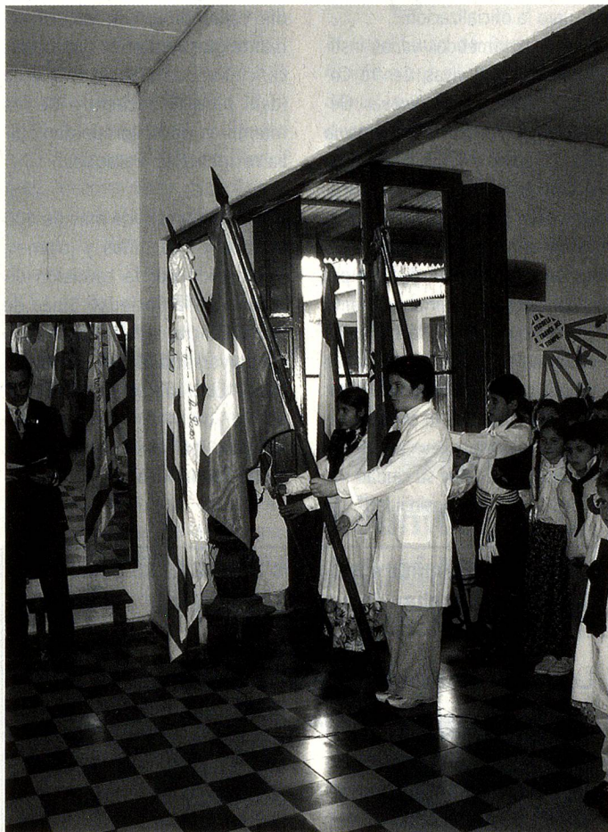
Acto en la Escuela Rural N° 20 "Suiza" en Laguna de los Patos

Distinta y muy emotiva fue la recordación que realizaron esa mañana del 1° de agosto, los niños de la Escuela Rural N° 20 "Suiza" de Laguna de Los Patos, próxima a Colonia del Sacramento, donde por primera vez ondearon juntas las banderas de Suiza y Argentina. Los asistentes cantaron ambos Himnos Nacionales, el Suizo, en italiano; realizaron una representación teatral sobre la