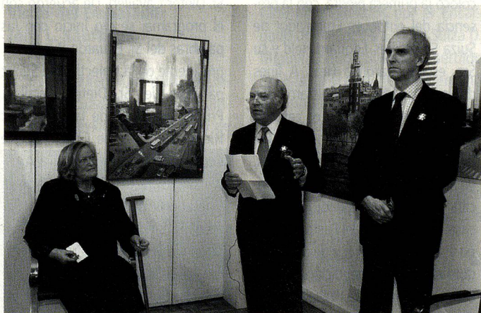
Presentación de la muestra de arte "Desde la Ventana"

La CCSA cita ya a todos sus miembros y a los suizos interesados en participar de un tercer evento, a principios de agosto de 2006.