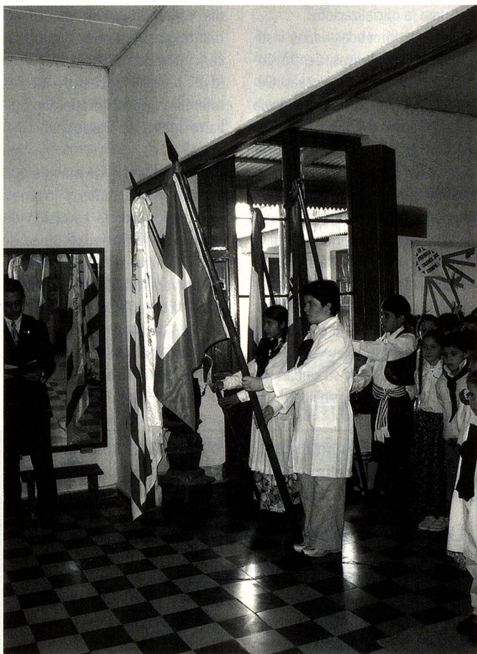
Acto en la Escuela Rural N° 20 "Suiza" en Laguna de los Patos

Distinta y muy emotiva fue la recordación que realizaron esa mañana del 1° de agosto, los niños de la Escuela Rural N° 20 "Suiza" de Laguna de Los Patos, próxima a Colonia del Sacramento, donde por primera vez ondearon juntas las banderas de Suiza y Argentina. Los asistentes cantaron ambos Himnos Nacionales, el Suizo, en italiano; realizaron una representación teatral sobre la