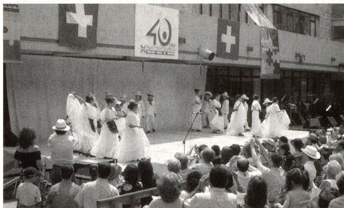
Los "Jarochitos" bailan la "Bamba", típico baile del Estado de Veracruz

Dos años después, el Colegio contaba con un amplio y funcional edificio, para mayor población estudiantil, con espacios para deportes, incluida una piscina, laboratorio de idiomas y de química, sala de computación, biblioteca y un gran Auditorio para eventos culturales. Así fue creciendo hasta llegar al año 1971 en que se dio la posibilidad de impartir el nivel de Preparatoria dentro del sistema multidisciplinario de CCH (Colegio de Ciencias y Humanidades) y agregar la enseñanza de inglés y francés. De esta manera, lo que en un principio favoreció a niños suizos, fue cimen-