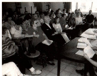
Integrantes del Consejo Directivo de E.V.A. dan lectura al informe de la entidad