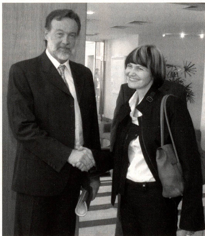
La Sra. Ministra con el Canciller Rafael Bielsa, en Bs. As.