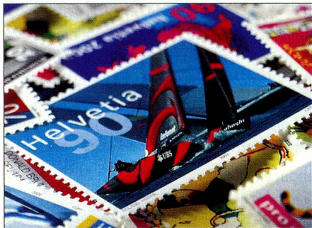
Mundialmente famoso: El sello especial «Alinghi, Switzerland» provocó una verdadera avalancha. Los pliegos se agotaron apenas emitidos.