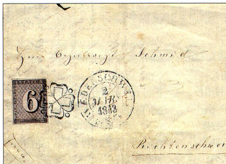
Premiere suiza: La primera carta con fraqueo postal que se conozca en Suiza fechada el 2 de abril de 1843.