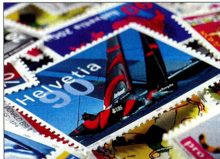
Mundialmente famoso: El sello especial «Alinghi, Switzerland» provocó una verdadera avalancha. Los pliegos se agotaron apenas emitidos.